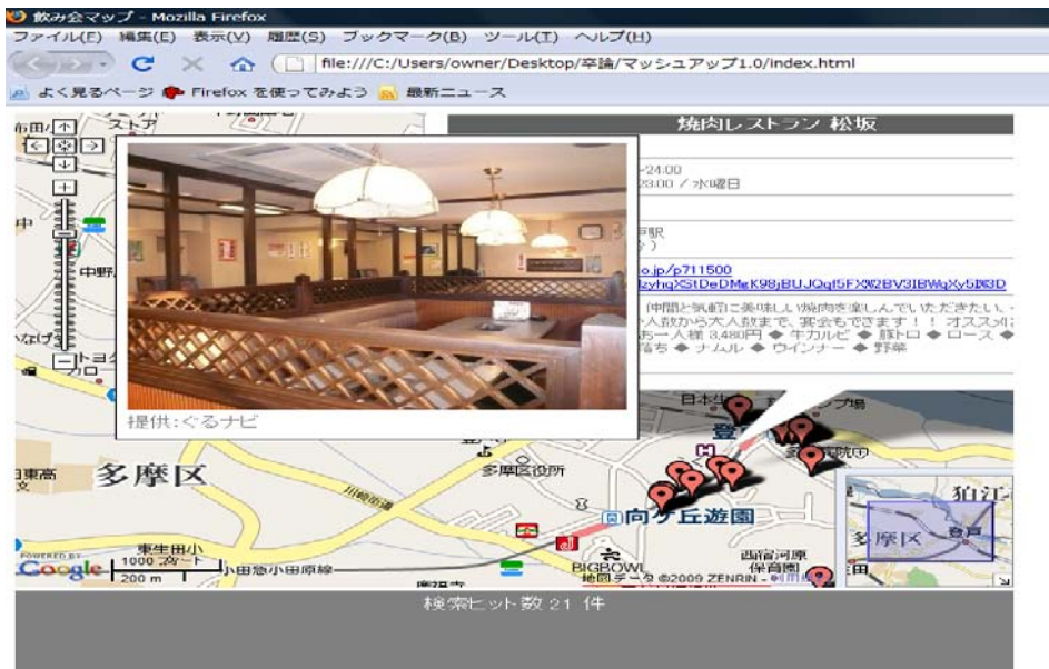
図 1：例題アプリケーションの実行画面

近年、Web サービスにおける API(Application Programming Interface)の公開に伴い、それらを組み合わせて使用マッシュアップ(Mashup)と呼ばれる Web サービス連携技術が普及しつつある。本論文では、マッシュアップサービスの更なる増加を見越し、サービスの構成を図示化することによる保守効率の向上の手法について述べる。