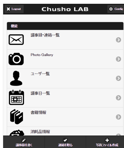
図 2 フレームワーク利用のトップ画面

近年、市場で著しい成長を遂げ、普及の進むスマートフォンやタブレット端末の利用を考慮し、多様なデバイスに対応可能なフレームワークである jQuery Mobile を実装に利用し、使い易さの向上を図った。図 2 は、システムログイン後のトップ画面であり、機能リストから各情報の閲覧、下部タブバーから交信内容の入力を行える。