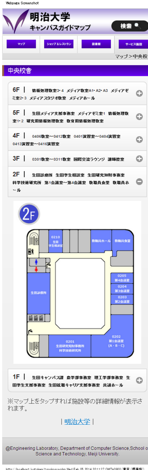
図3 フロアガイドマップ

図書館については、既存の明治大学公式Webアプリ(iMeiji)で、新入生や来訪者向けの情報提供が行われているので、そのサイトへのリンクを付けることで対応することにした。